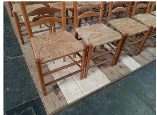
Figuur 6. De herstelde vlonders

Enkele vlonder-planken in de kerk zijn vervangen, ze waren op een aantal plaatsen gebarsten en versleten.