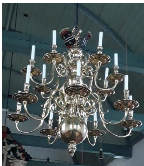
Figuur 4. Een van de gerestaureerde kroonluchters met de wapens van de families Cats en Ter Coulster

Voor het restaureren en poetsen van al het koperwerk in de kerk, waaronder de