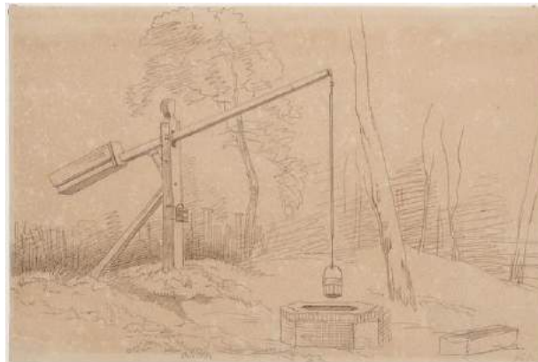
Figuur 2. Het putje met de sarcofaag op een pentekening uit de 19e eeuw

Intussen is de sarcofaag schoon gemaakt door Maarssen Steenhouwerij en teruggebracht naar Heiloo. Door Atelier Boris uit Alkmaar is een fraai, passend onderstel voor de sarcofaag vervaardigd.