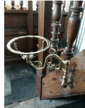
Figuur 5. Het Doopvont

De restauratie van alle koperen onderdelen in de kerk is tijdens het schrijven van dit verslag gereed gekomen. Daarbij behoort ook een klein Doopvont dat bevestigd is aan de preekstoel, een kleinood. Jammer genoeg ontbreekt daaraan het glazen (of metalen) bekken, met een doorsnede van 20cm. Hopelijk kan daar later een oplossing voor worden gevonden.