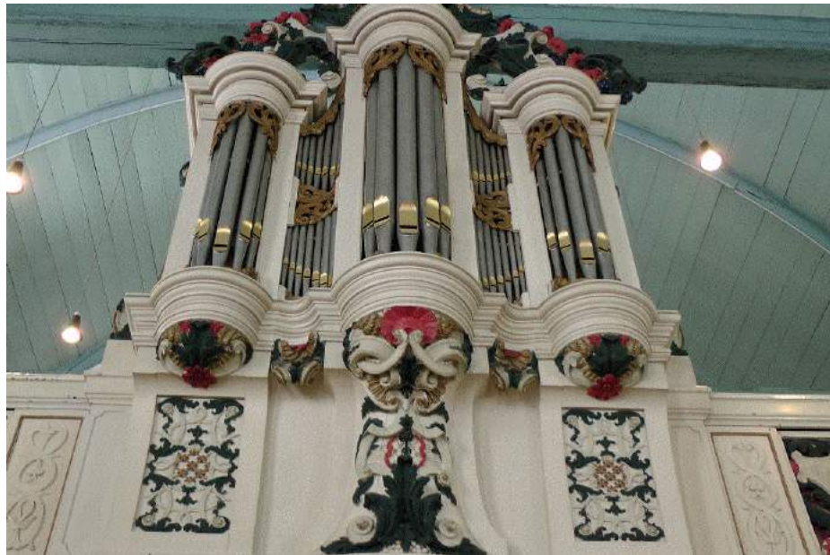
Figuur 7. Het grote orgel met de kleuraccenten

De uitkomsten van het kleuronderzoek brengen met zich mee dat er kleurkeuzes gemaakt moeten worden tussen behoud van de huidige kleurstelling uit 1965, terugkeer naar een eerdere kleurstelling of te kiezen voor een nieuwe kleurstelling die geïnspireerd is op de bevindingen van het onderzoek. Die keuzes zullen pas gemaakt worden in samenhang met andere werkzaamheden en in samenspraak met de monumentencommissie.