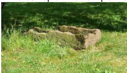
Figuur 3. De sarcofaag bij de Abdij

Er worden op dit moment plannen uitgewerkt om de torenruimte aan te passen en museaal in te richten. Het plan is om de twee restant sarcofaagdeksels die op de tweede verdieping in de toren staan, naar beneden te brengen en aan de noordmuur in de torenruimte te bevestigen. Ook de verlichting van de torenruimte zal daarop worden aangepast. De gemeente en de monumentencommissie zijn positief over dit initiatief.