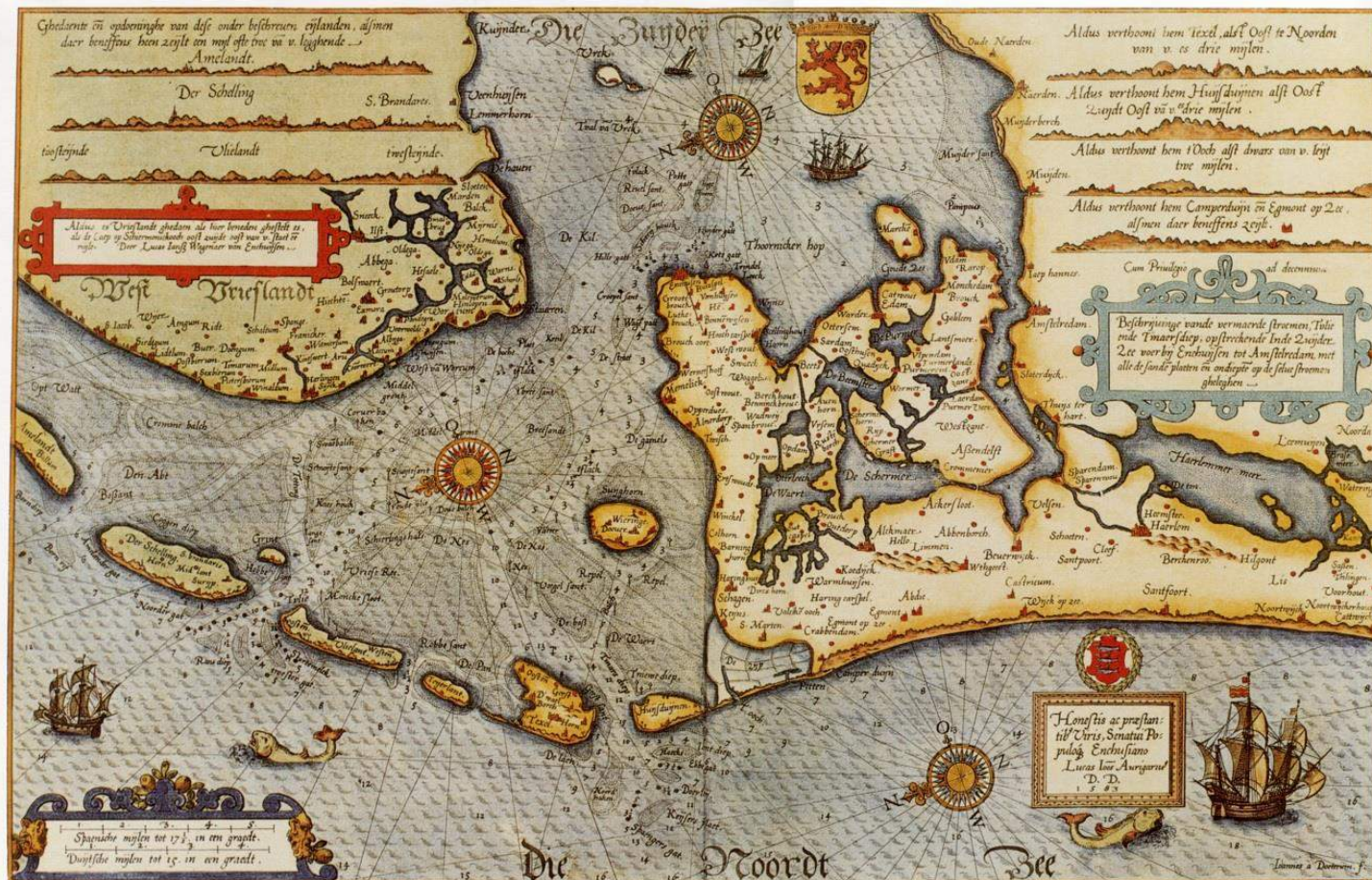
Figuur 10. Heiloo, een stipje op de zeekaart uit 1583 van de cartograaf Lucas Jansz Wagenaer (1533-1606) uit Enkhuizen

Stichting Monument Witte Kerk Heiloo Heerenweg 12, 1851 KS Heiloo www.wittekerk-heiloo.nl info@wittekerk-heiloo.nl