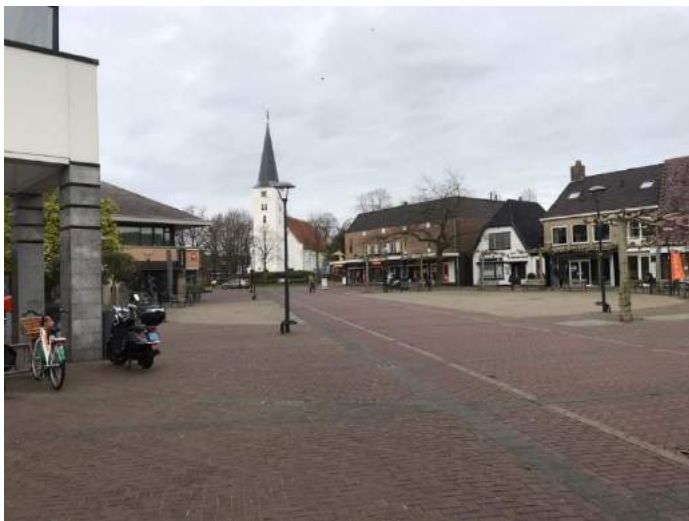
Figuur 8 't Loo plein, opname maart 2020

In opdracht van de gemeente Heiloo is er door drie studenten van de Hogere Agrarische School te Den Bosch een studie verricht naar de mogelijkheden om het Loo plein zodanig te herinrichten dat er een eigentijdse inrichting van het Loo plein ontstaat. De studenten hebben bij een breed publiek meningen gepolst, wensen geïnventariseerd en schetsplannen gemaakt. Een vertegenwoordiging van de Witte Kerk is nauw betrokken geweest bij de totstandkoming van de (schets) plannen.