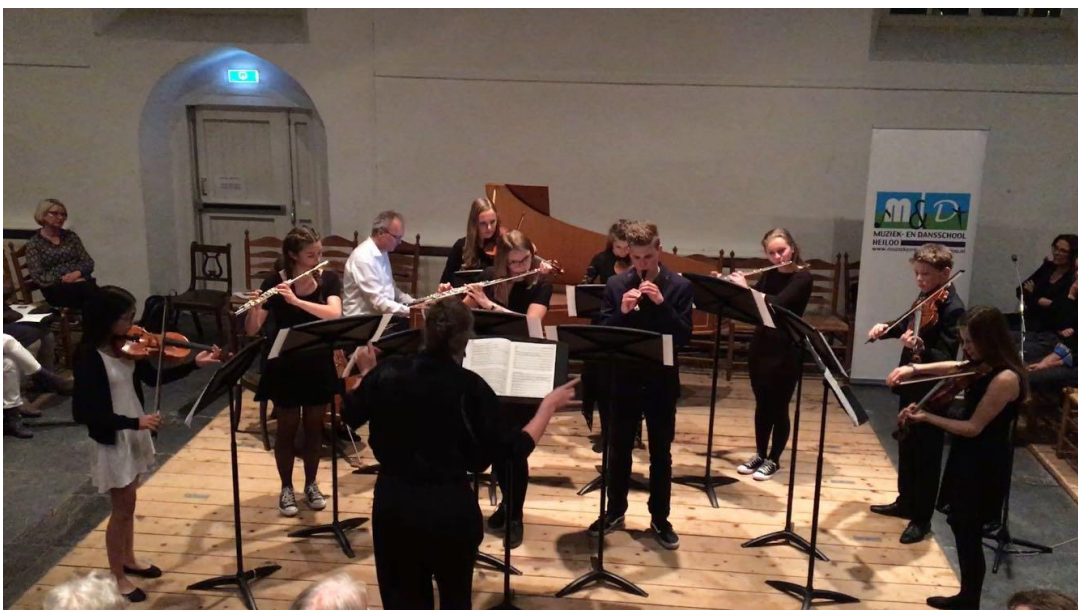
Het studentenensemble van de Dans- en Muziekschool Heiloo in de Witte Kerk.

Op 20 december werd een kerstconcert gegeven door studenten van de Dans- en Muziekschool Heiloo. Zowel publiek, waaronder ouders en grootouders, als docenten en studenten waren enthousiast over de ambiance die stimulerend werkt. Zoals gebruikelijk werd alle musici aan het eind een bloemetje uitgereikt. Ook dit jaar mochten we hiervoor van TAQA een bijdrage in de kosten ontvangen.