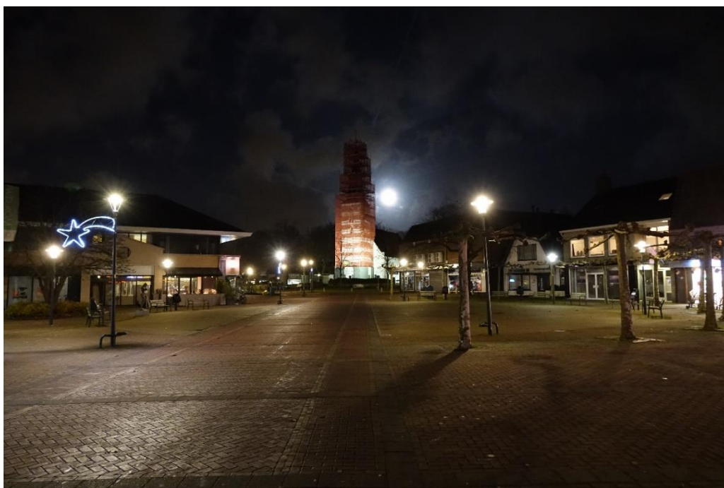
De toren van de Witte Kerk in de steigers december 2017